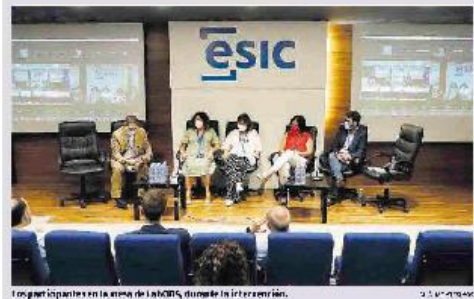
El panel de expertos en la mesa de LabODS, durante la conferencia.

Be no (ES) quiere ayudar a las empresas a aplicar medidas en la línea de los objetivos globales.