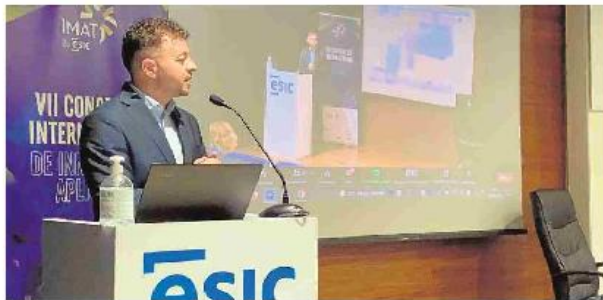
IMAT 2021. El congreso se celebró esta semana en formato híbrido con más de 80 ponentes